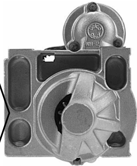
▲ Late Version ■ Version récente ■ Versión posterior

Design Change Modification de Conceptio Cambio de diseño